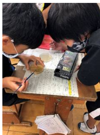
子供たちの体験学習の様子