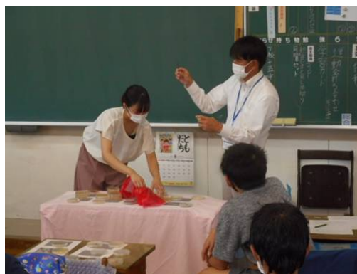
子供たちに説明する当社研究員